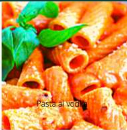
Pasta al vodka