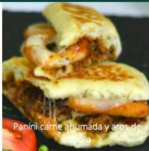
Panini carne ahumada y aros de cebolla