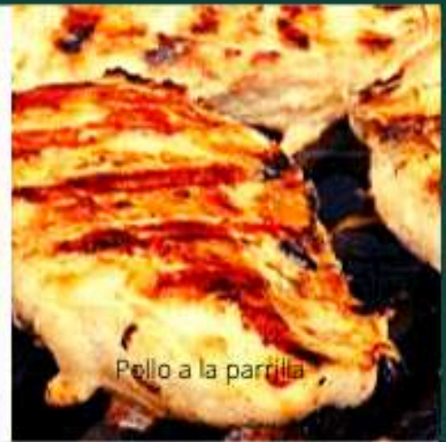
Pollo a la parrilla