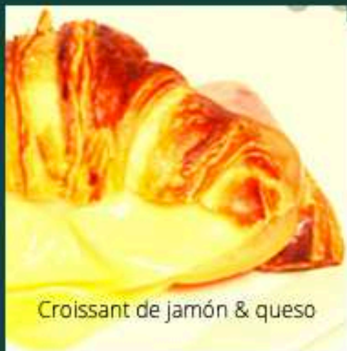
Croissant de jamón & queso