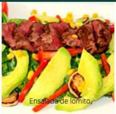
Ensalada de lomito