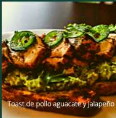
Toast de pollo aguacate y jalapeño