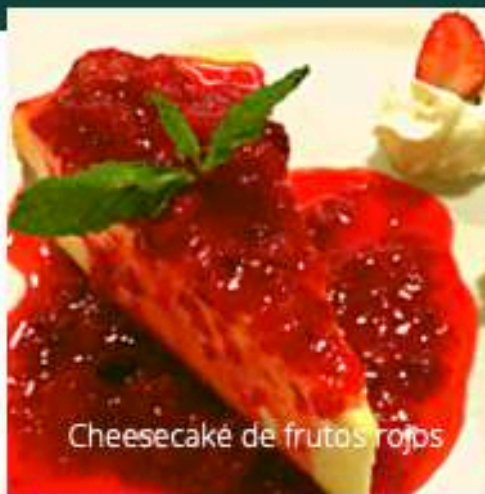
Cheesecake de frutos rojos