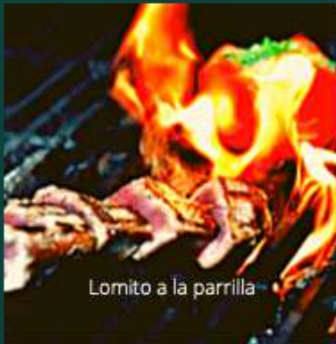
Lomito a la parrilla