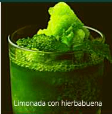
Limonada con hierbabuena