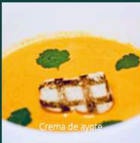
Crema de ayote