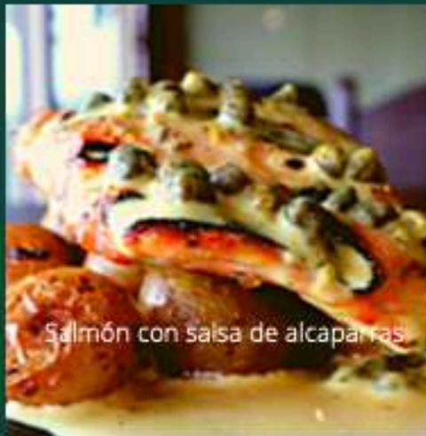
Salmón con salsa de alcaparras